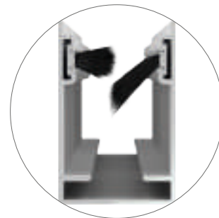
OPTIONAL SPAZZOLINO ANTIVENTO