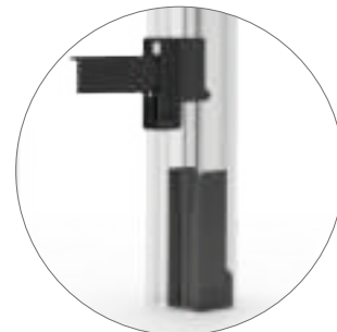
OPTIONAL CLIC CLAC AGGANCIAMENTO RAPIDO