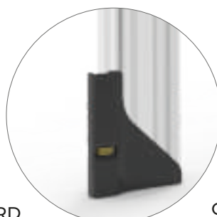
STANDARD AGGANCIAMENTO REGOLABILE

N.B.: Per L fino a 600mm H massima realizzabile 1400 mm