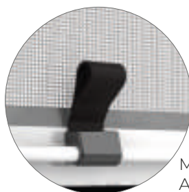
MANIGLIETTE PER AGGANCIAMENTO MAGNETICO