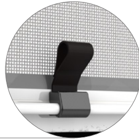
MANIGLIETTE PER AGGANCIO MAGNETICO

N.B.: Le misure devono essere trasmesse esclusivamente come misure finite